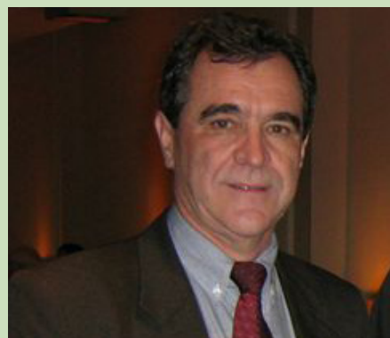
José Agenor Álvares da Silva, Ministro da Saúde

O Ministério da Saúde tem apoiado substancialmente a SBMFC e AMMFC através da realização de eventos, incentivo para publicações e outras parcerias. Pensamos que este é um movimento da sociedade civil que complementa as ações do Ministério. A prova de título de especialista é um exemplo. Há duas formas de se tornar especialista no Brasil: através de residência médica reconhecida pela Comissão Nacional de Residência Médica ou através de titulação pela sociedade de especialidade filiada à Associação Médica Brasileira. No caso da Medicina de Família e Comunidade apenas a SBMFC, à qual a AMMFC é filiada, tem esta prerrogativa. Isto é importante para qualificar a Estratégia Saúde da Família. O Ministério da Saúde tem apoiado estas iniciativas também porque sabe que estas entidades especificamente têm o trabalho voltado prioritariamente para a saúde pública e fortalecimento do Sistema Único de Saúde.