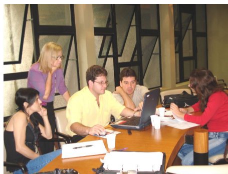
AMMFC e UNIUBE: parceria.