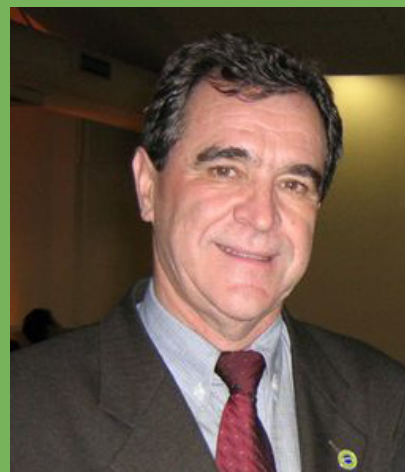
José Agenor Álvares da Silva, Ministro da Saúde

[ Entrevista exclusiva com o Ministro da Saúde ]